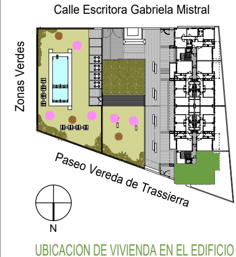
UBICACION DE VIVIENDA EN EL EDIFICIO